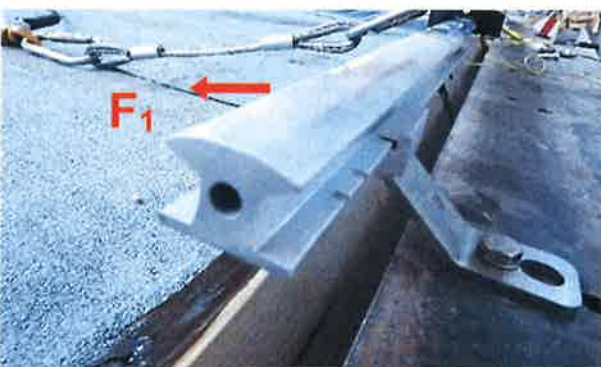
Bild 15: Montierte Führung der Anschlagseinrichtung, Typ: ABS AluTrax für die Krafteinleitung in Richtung F_1