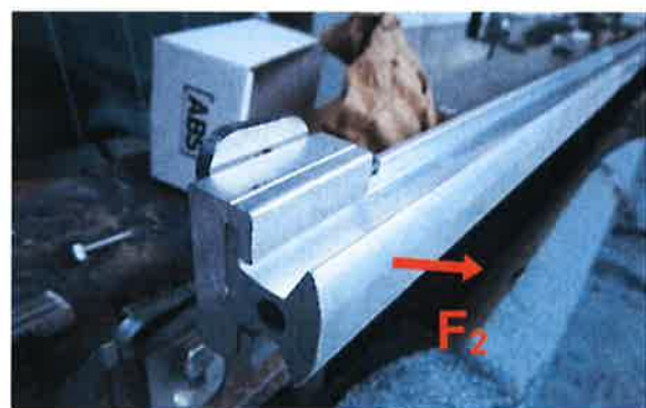
Bild 16: Montierte Führung der Anschlagseinrichtung, Typ: ABS AluTrax für die Krafteinleitung in Richtung F_2