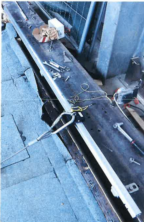
Bild 18: Anschlagereinrichtung, Typ: ABS AluTrax, Systemaufbau mit Halterabstand von 1,0 m