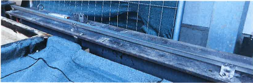
Bild 17: Anschlagereinrichtung, Typ: ABS RailTrax, Systemaufbau mit Halterabstand von 1,0 m