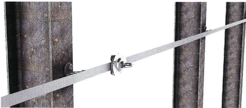
Bild 1: ABS RailTrax (Montagebeispiel) mit beweglichen Anschlagpunkt, Typ: Schienengleiter

Die Anschlageinrichtung Typ: ABS RailTrax (Bilder 1 - 5) dient zur Sicherung von Personen. Als starre Führung kommt ein T-Profil aus Stahl (Breite 30 mm) zum Einsatz, auf welcher der bewegliche Anschlagpunkt, Typ: Schienengleiter läuft. An diesem kann sich der Benutzer mit seiner mitgeführten persönlichen Schutzausrüstung gegen Absturz sichern. Die Montage des Systems erfolgt horizontal mittels der vorgesehenen Halter und Stoßverbinder aus Edelstahl. Die maximale Feldlänge, d.h. der Abstand zwischen zwei Haltern, beträgt 1,0 m. Der Endhalter wird direkt am Ende der Führung positioniert.