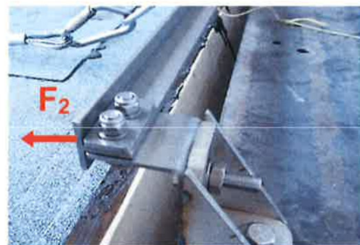
Bild 14: Montierte Führung der Anschlagseinrichtung, Typ: ABS RailTrax für die Krafteinleitung in Richtung F_2