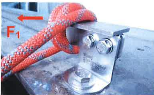
Bild 13: Montierte Führung der Anschlagseinrichtung, Typ: ABS RailTrax für die Krafteinleitung in Richtung F_1