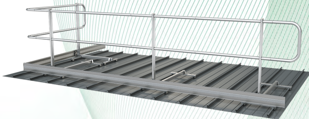
Bild 1: Seitenschutz, Typ: ABS Guard onTop Falz (Montagebeispiel)

Die maximale Feldgröße bei innenliegenden Feldern und Feldern mit Wandbefestigung beträgt 2,5 m. Außenliegende Felder haben eine maximale Feldgröße von 1,5 m. Das Bild 11 zeigt die genannten Komponenten, zusammengestellt zu der Aufstellvariante: ABS Dome onTop Falz. Hierbei beträgt die maximale Feldgröße 2,5 m.