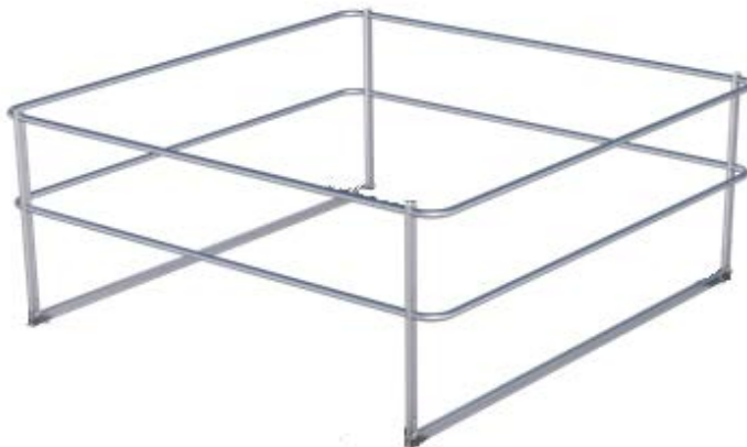
Bild 11: Aufstellvariante des Seitenschutzsystems, Typ: Dome onTop Falz