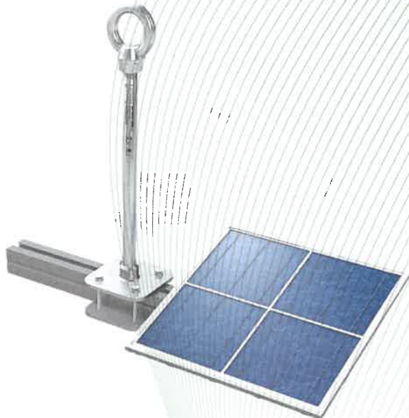
Bild 1: Anschlageinrichtung, Typ: ABS-Lock® X-Solar, montiert an Aluminiumschiene (Montagebeispiel)

Die Anschlageinrichtung ist für die Beanspruchung in alle Richtungen vorgesehen und besteht aus korrosionsbeständigem Stahl.