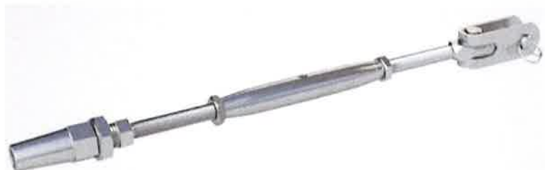
Figure 4 : Élément tendeur