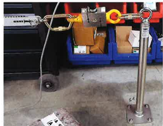
Figures 5 et 6 : Détails concernant l'appareil de test