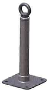
Figure 3 : ABS-Lock ® X-SR