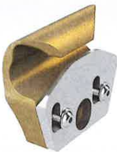
Figure 1 : Point d'ancrage mobile de type UniGlide

Le dispositif de guidage est précontraint par les composants du système selon la figure 4.