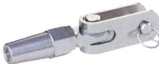
Figure 2 : Raccord d'extrémité